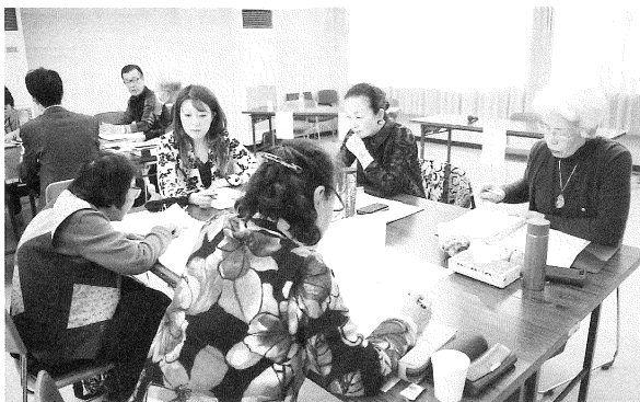
◎グループ討議の様子

また、対人援助演習や司法書士の先生方を交えての事例検討では、活発な意見交換が行われました。