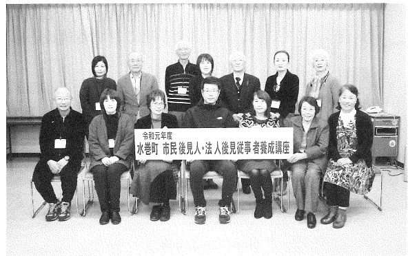
◎最終日参加された皆様で記念撮影

認知症や知的、精神などの障がいにより、判断能力が十分でない人の権利と財産を保護する「成年後見制度」の新たな担い手として、地域住民の視点で支援を行う「市民後見人」ならびに法人等団体の職員を対象とした地域住民の権利擁護に貢献する「法人後見従事者」の養成講座を開催しました。全7日間のカリキュラムを修了された受講生の皆さんはこの講座を通して「成年後見制度」の概要をはじめ、対象となる方への理解、市民後見人の役割などについて理解を深めていきました。